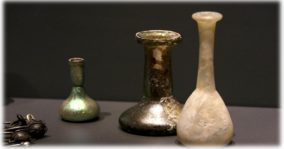
Kayseri Arkeoloji Müzesi M.Ö. 4.Yy Kalma Göz Yaşı Şişeleri