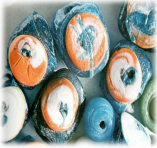
Çeşitli boyutlarda Göz boncukları (Küçükerman, 1988: 17).