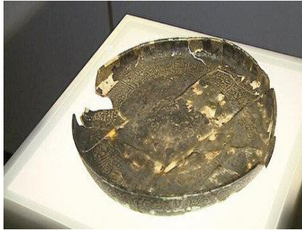
Kubadabad'dan Cam Tabak (Konya Karatay Müzesi)

Bu döneme ait buluntular çok az sayıda olması nedeniyle birden fazla örneğe ulaşılamamıştır. Bu dönemi yansıtan ürünlere birkaç örnek verecek olursak;