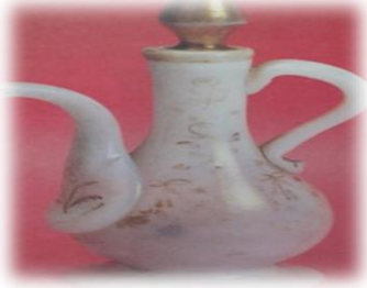
Opal Beykoz ibrik (Özgümüş, 2000: 80)