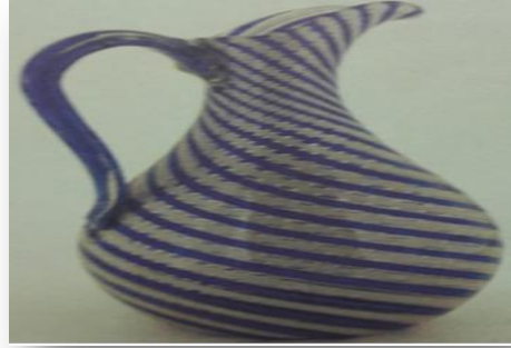
Çeşm-i Bülbül sürahi (Türkiye Şişe ve Cam Fabrikaları Anonim Şirketi) (Özgümüş, 2000: s.82)