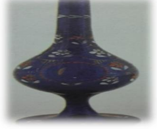
Renkli Beykoz gülabdan (Özgümüş, 2000: 79)