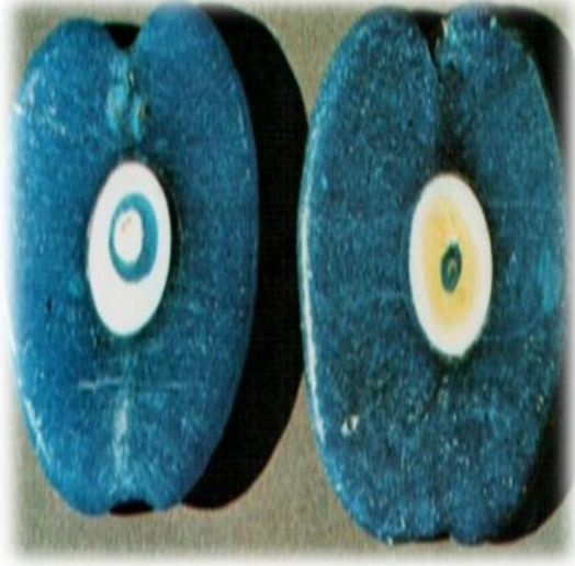
Ezme tekniği ile yapılmış nazar boncukları (Küçükerman, 1988: 73)