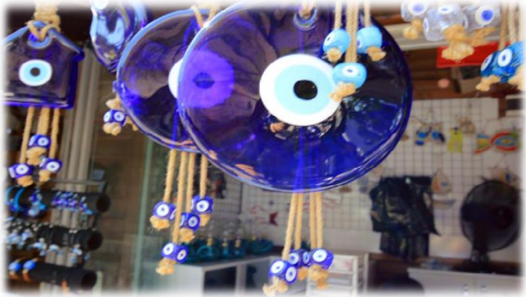
Nazar Boncukları (Hülya Özar, Yüksek Lisans Tezi İzmir Yöresinde Geleneksel Boncuk Üretimi Ve Koruma Önerileri , Pamukkale Üniversitesi. 2019 s:13